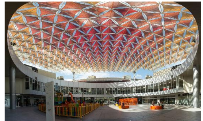
C.C. Nervión Plaza