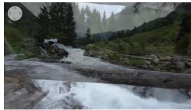
Val di Sole Trentino