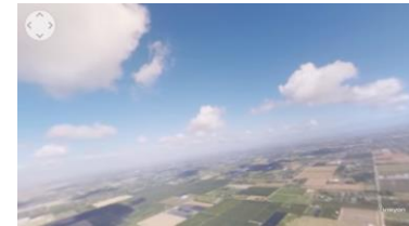
Paracaidismo en Florida